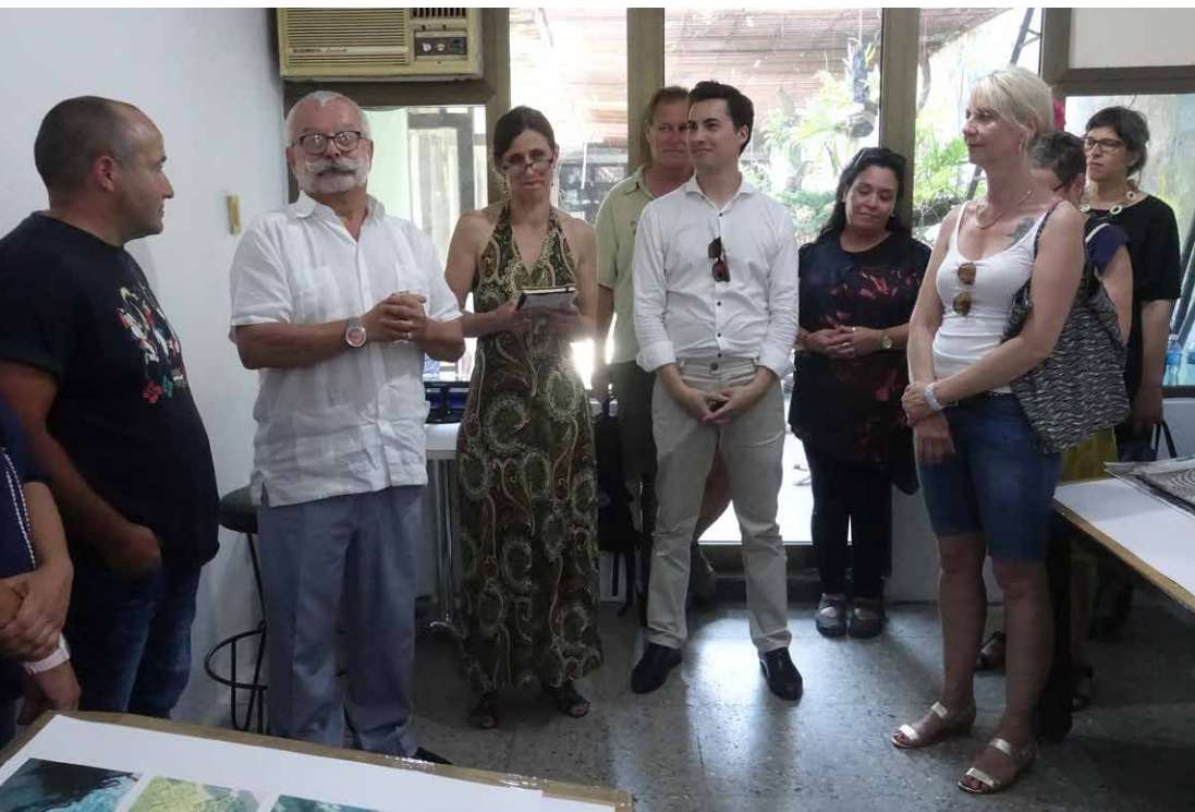
Impressionen – Schlusspräsentation im Taller Experimental de Gráfica in Havanna, Kuba