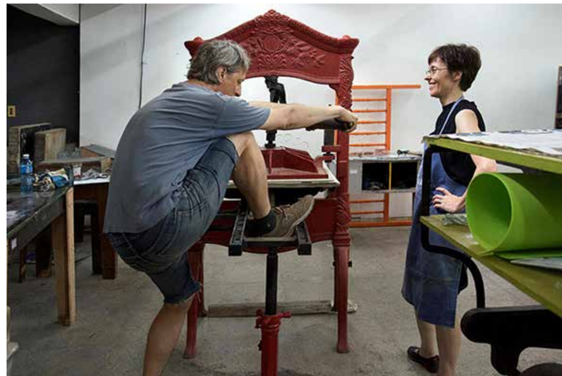
Printed in Cuba – Cuba meets USA meets Switzerland