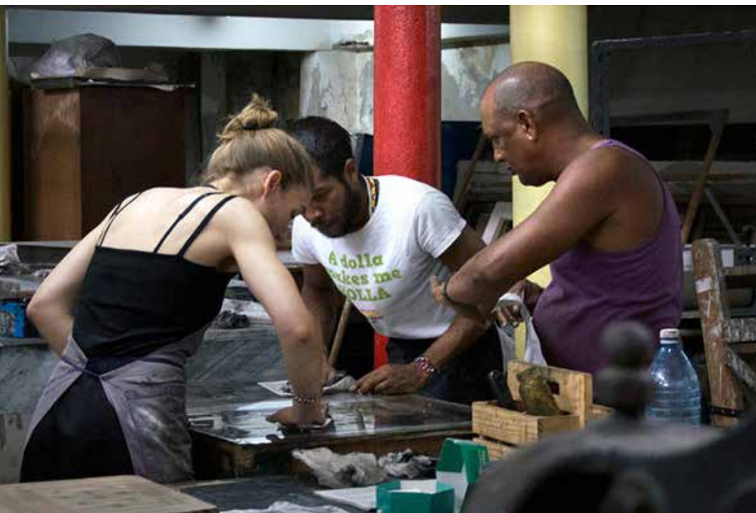
Impressionen – Taller Experimental de Gráfica in Havanna, Kuba