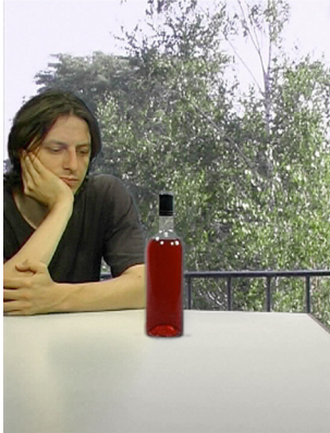
Abbildung: Video-Stills Vom Sein ... und andere Dingen 1-Kanal Audio-Video-Installation Susanne Schär & Peter Spillmann . 2000